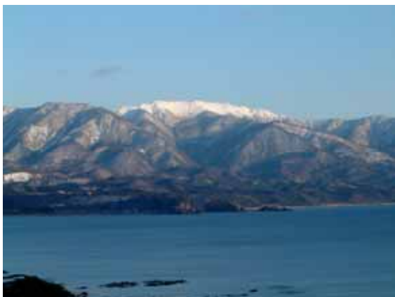
白神山地を抱える白神岳