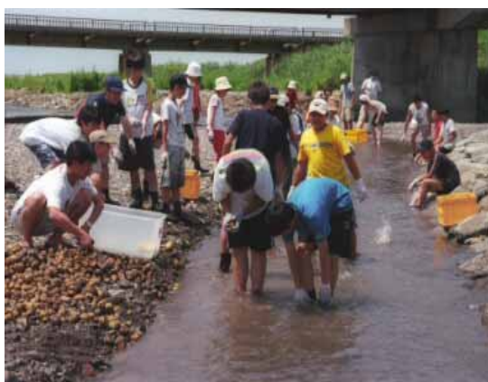
農業体験で収穫したジャガイモを川で洗う子どもたち